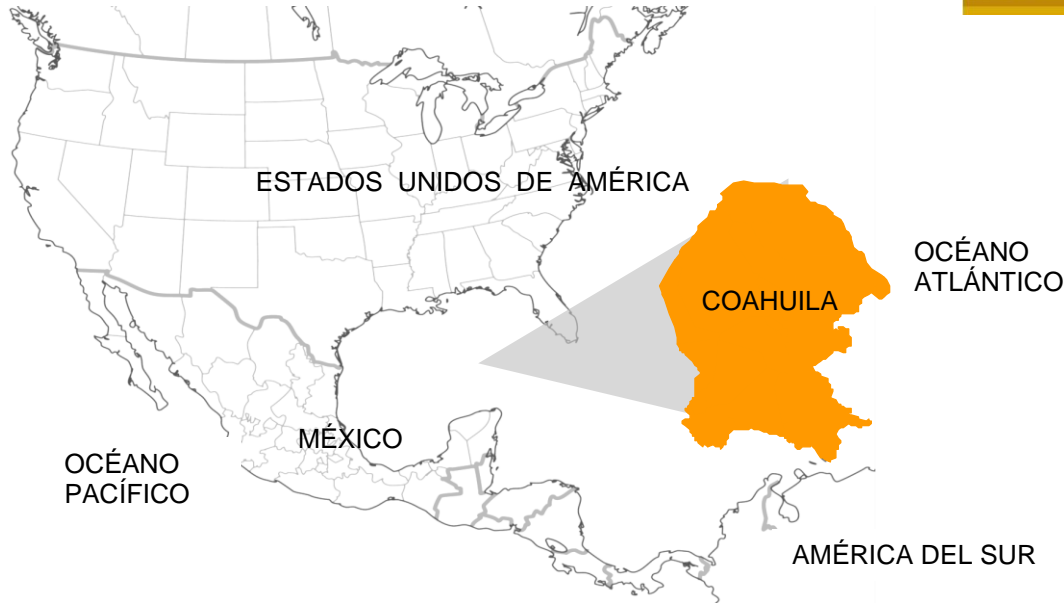
Ubicación de Coahuila de Zaragoza en Norteamérica.